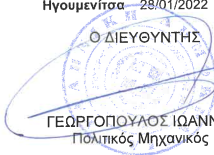
ΓΕΩΡΓΟΠΟΥΛΟΣ ΙΩΑΝΝΗΣ Πολιτικός Μηχανικός